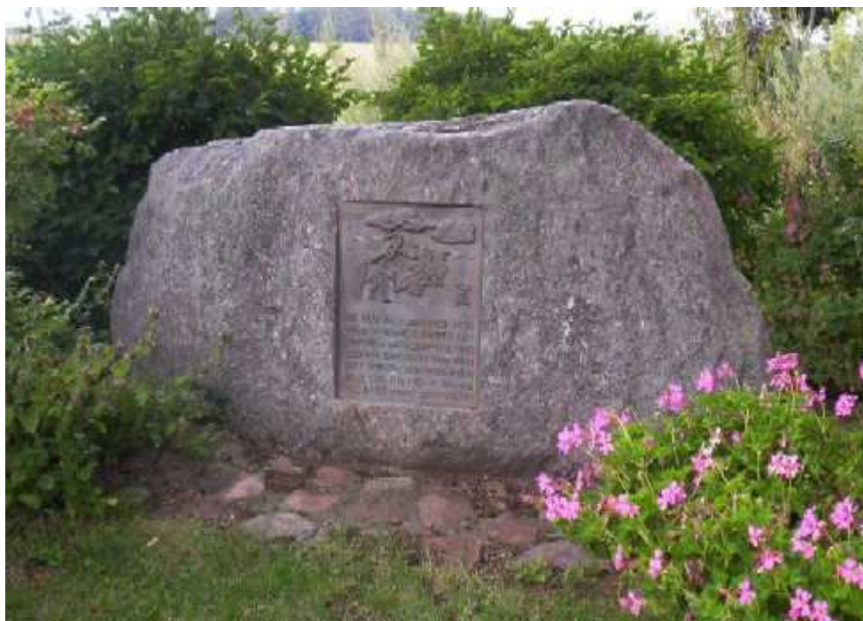
WENSE: Jubiläumsdenkmal (Dorfstraße, Feuerwehrgerätehaus)