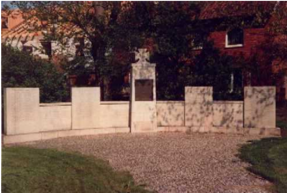
RÜPER: Befreiungskriege 1815 und Regierungsjubiläum 1913 (Meerdorfer Straße, südlich der Kirche)